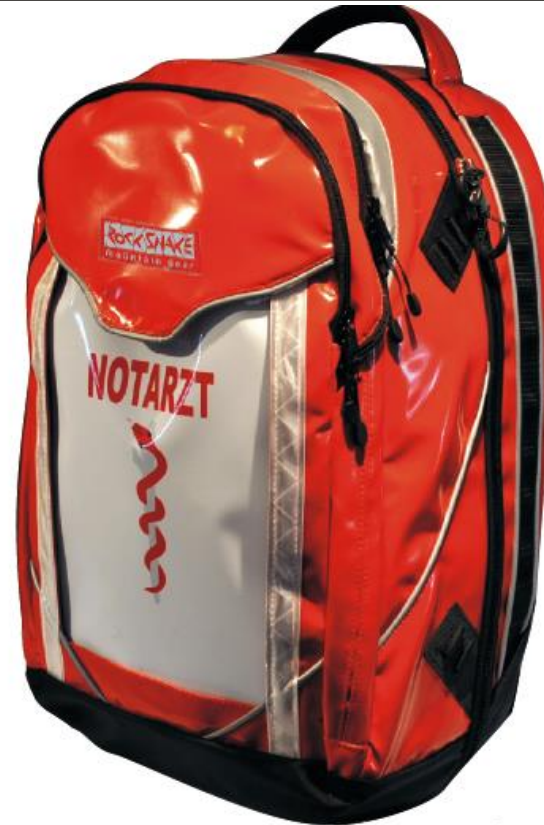
77500 fieryred (Ausrüstung gegen Mehrpreis: Wechsel-front Askulapstab)