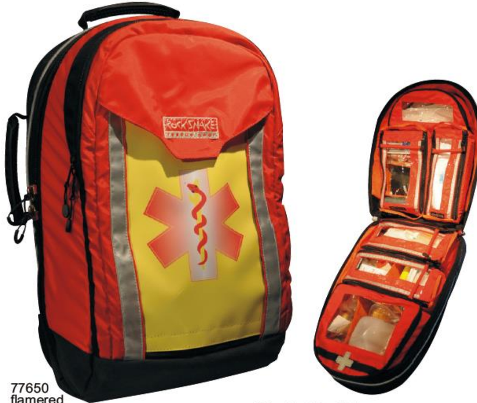
77650 flamered (Ausrüstung gegen Mehrpreis: gelbe Front mit Star of life)